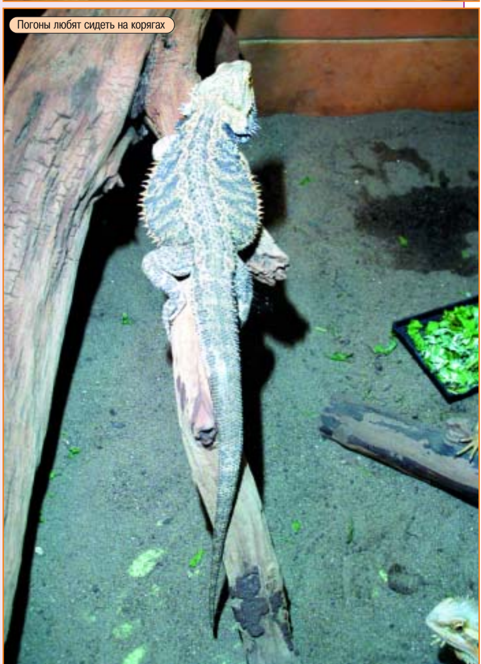
Погоны любят сидеть на корягах