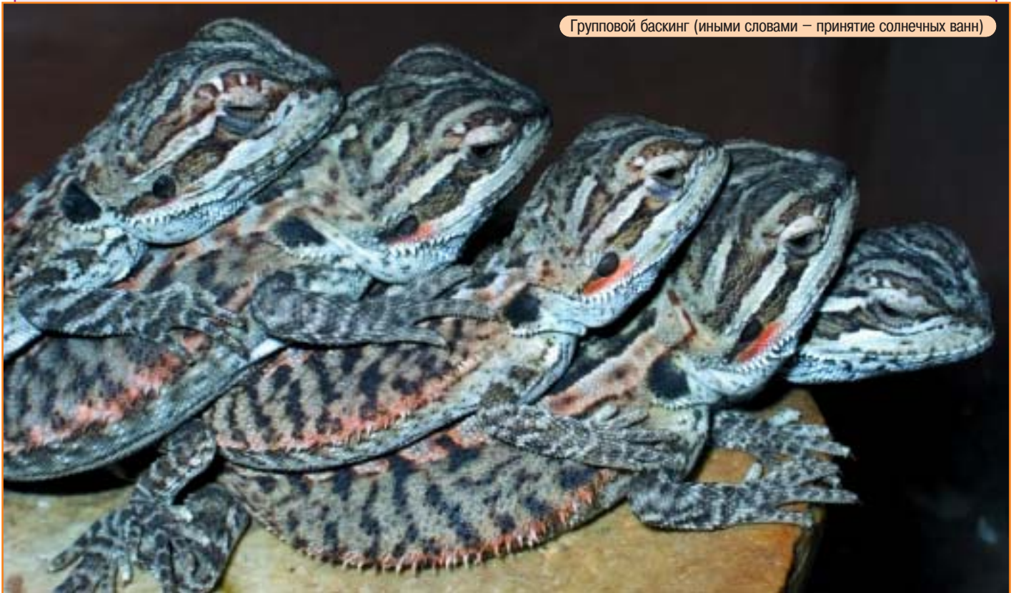
Групповой баскинг (иными словами – принятие солнечных ванн)

–, Æ ~ ÌÈ È % Ù „ÈÀ ÍÓ ÌÓ – , Æ Ì+ÒÀÍÓÍ Æ. –+Á, Ó%Ì Æ ÙÀ Æ ÆÛÌ Æ ÈÈ, ÓÚÌ Æ (Ò %ÓÍÛÌÀÛ+ÌÈ). "À Æ Æ ÆÛÌ Æ Ì Æ Æ Æ Æ. ÒÌ– ÒÛÌ, Û Æ ÆÈ ÒÓ ÒÓ% Æ Æ Æ Æ. ÙÀ Æ Æ ÆÛÌ Æ Æ ÆÈ, ÓÚÌ Æ Æ Т. 8-903-765-35-54 e-mail: aeg-studio@mtu-net.ru