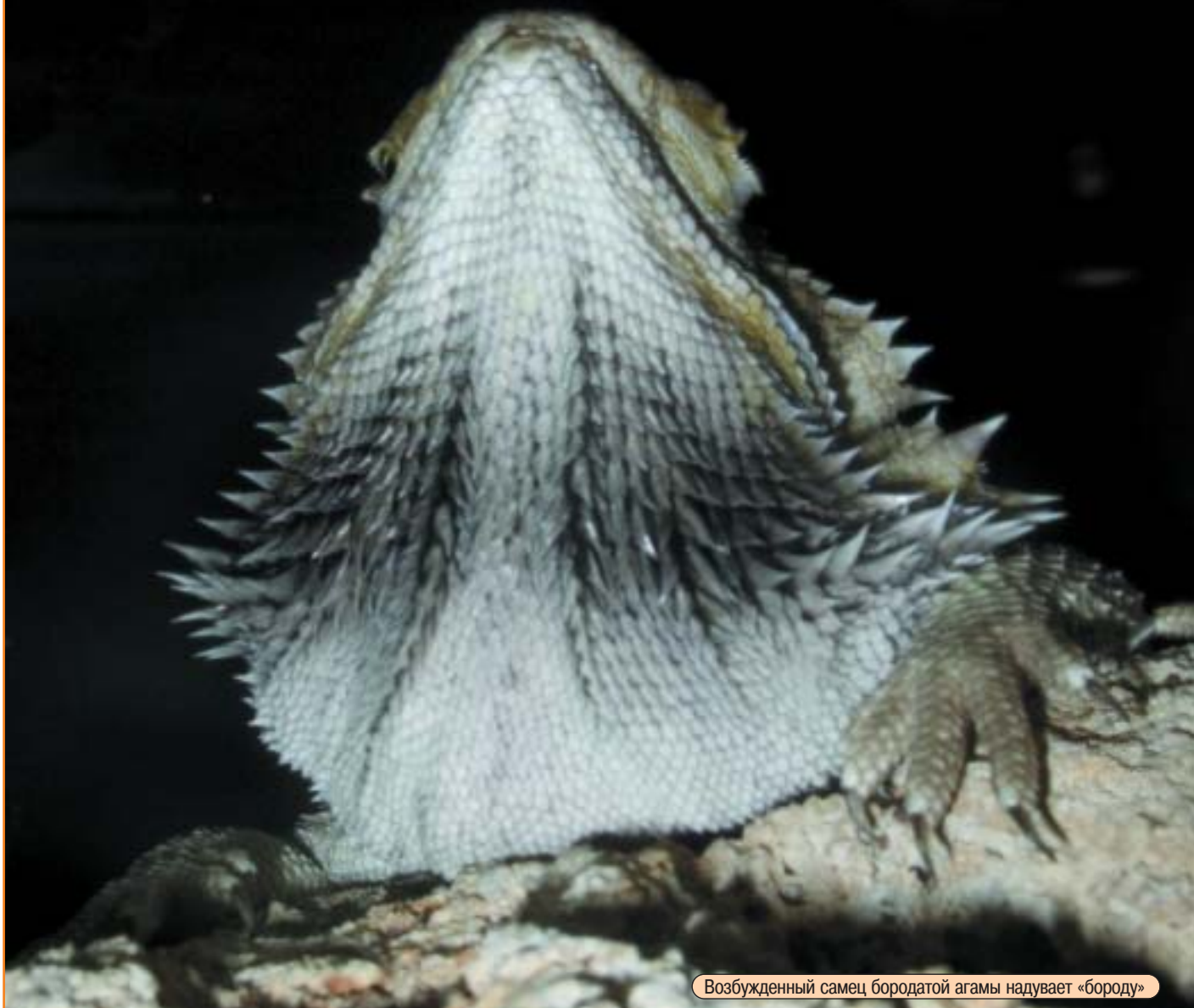
Возбужденный самец бородатой агамы надувает «бороду»

М еня нередко спрашивают, какое пресмыкающееся лучше всего завести начинающему любителю? До недавнего времени дать ответ на этот вроде бы простой вопрос было сложно. Ведь нужно учитывать не только стоимость самого животного, но и возможность приобретения необходимого оборудования, неприхотливость животного, а