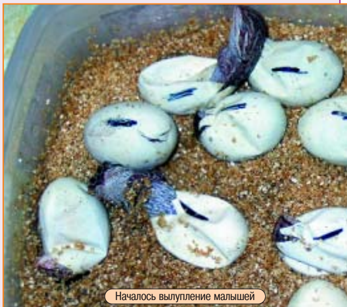
Началось вылупление малышей