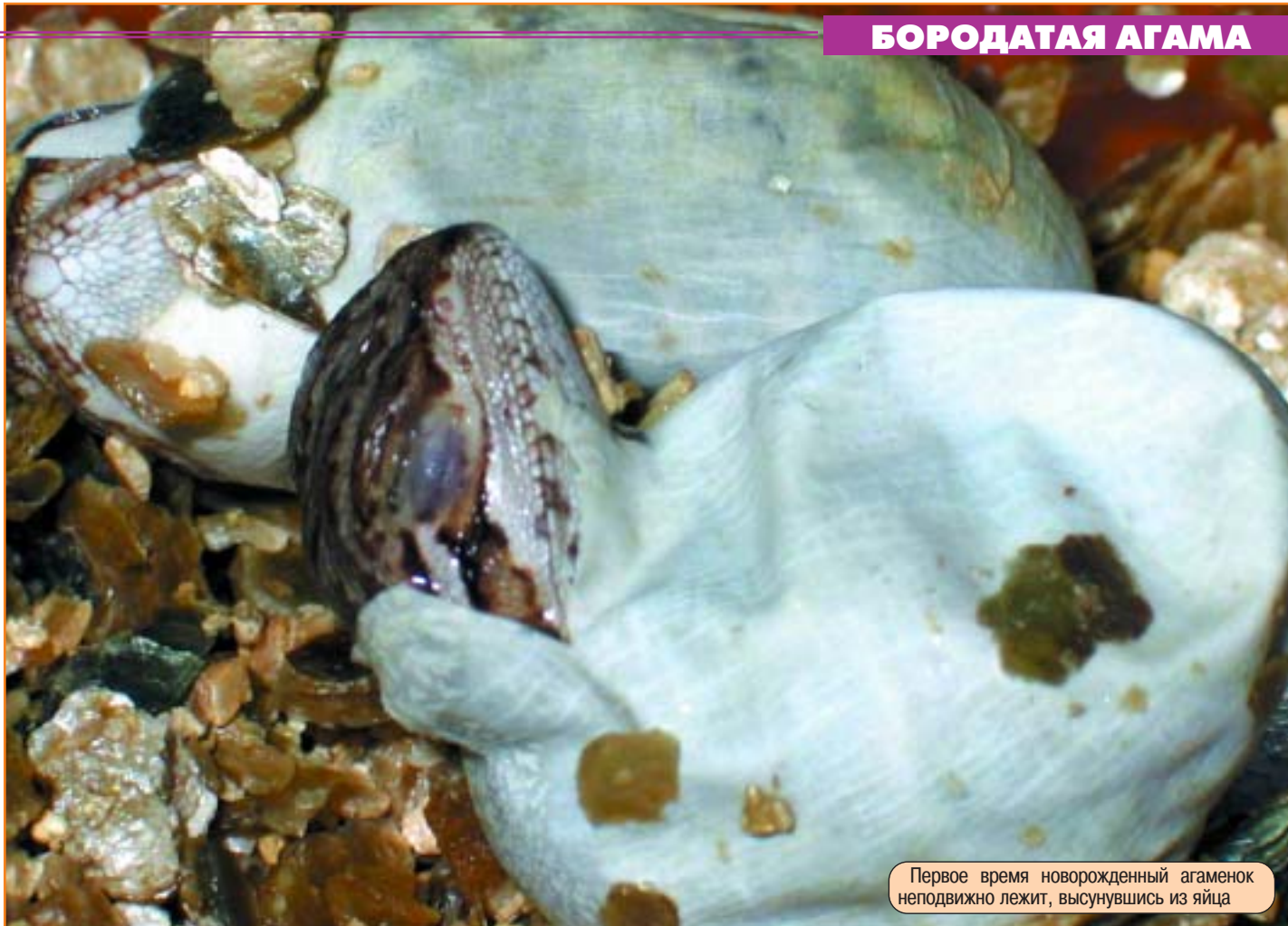
Первое время новорожденный агаменок неподвижно лежит, высунувшись из яйца

террариума, а также от вашего кошелька. Продолжительность освещения 12–14 часов. Обязательным условием является высокая температура: днем под греющей лампой 30–40°C, в «холодном» углу – 20–25°C. Ночная температура 20°C, для животных старше трех месяцев – не ниже 16°C. Над кам-