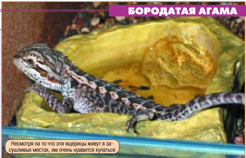
Несмотря на то что эти ящерицы живут в засушливых местах, им очень нравится купаться

Обитает Pogona vitticeps в каменистых сухих или полусухих местах с редкой растительностью, например в за-