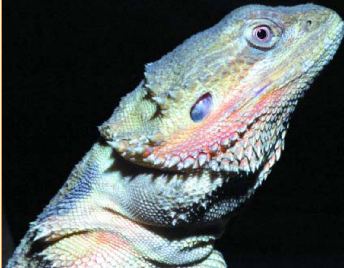
Портрет в профиль

рослях колючего кустарника или сухом лесу восточных штатов Австралии. Живет преимущественно на земле, но ящериц можно встретить и на деревьях, заборах или других возвышенностях. Нередко встречается в населенных пунктах, в том числе и городах. Теплолюбивый дневной вид, но в жару стре-