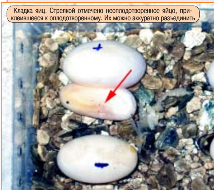
Кладка яиц. Стрелкой отмечено неоплодотворенное яйцо, приклеившееся к оплодотворенному. Их можно аккуратно разъединить

мендуется использовать лампы «Repti Glo 8» или аналогичные, с долей ультрафиолетовых лучей В не менее 8%. Для правильной цветопередачи часть ламп «Repti Glo 8» можно заменить «Repti Glo 2». Пересветить такой террариум сложно, поэтому количество используемых ламп зависит от размеров