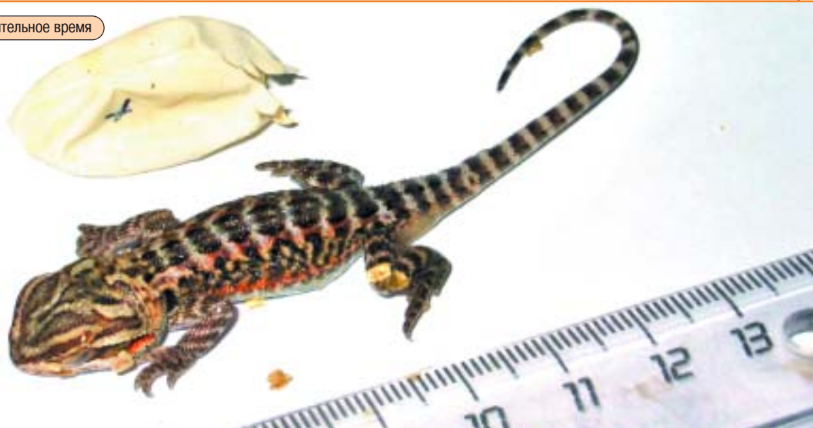
Он же через непродолжительное время

В неволе около 70% диеты составляют сверчки и другие беспозвоночные. Ящерицам очень нравятся зофобусы (гигантский мучной червь), но поскольку эти личинки не настолько пи-